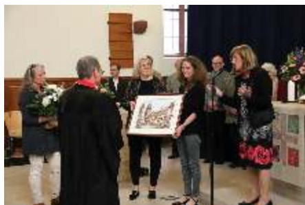
Das Abschiedsgeschenk des Presbyteriums