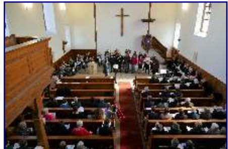
Posaunenchor und Kirchenchor in der Johanneskirche