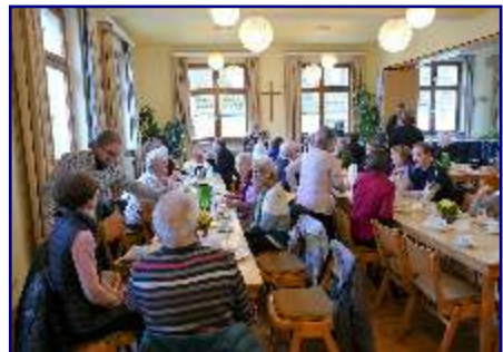
Später waren alle zu einem Empfang im Gemeindehaus eingeladen.