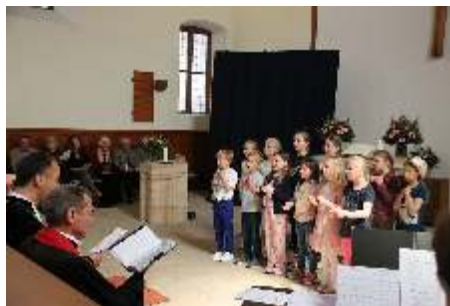
Die Grundschul Kinder bei ihrem Auftritt.